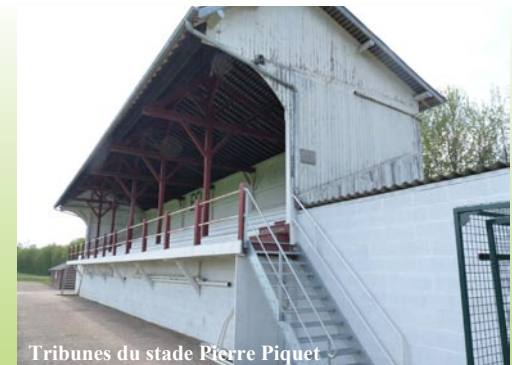
Tribunes du stade Pierre Piquet