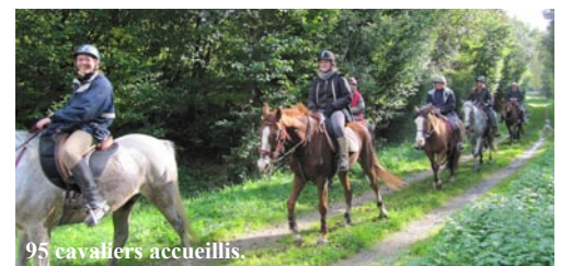
95 cavaliers accueillis.

Les élus souhaitent à présent pérenniser cet événement. Il sera reconduit en 2011, très certainement le dimanche 23 octobre.