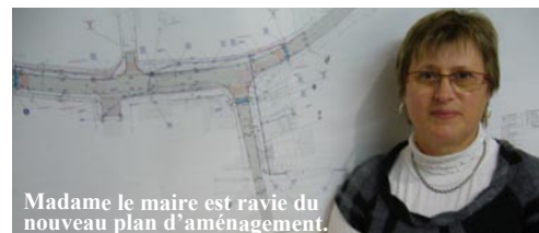
Madame le maire est ravie du nouveau plan d'aménagement.

5000 véhicules traversent en effet chaque jour la commune. Des plateaux surélevés vont être créés et la vitesse sera limitée à 30km/heure de façon à inviter les conducteurs à ralentir.