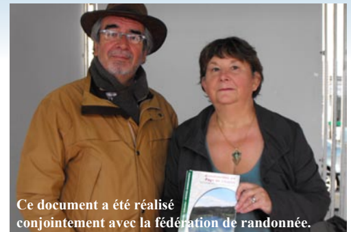
Ce document a été réalisé conjointement avec la fédération de randonnée.

Une réflexion est actuellement menée pour aménager et animer ces différentes boucles.