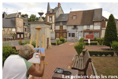
Les peintres dans les rues.

Pour tous renseignements, contacter Matthieu Vesques au 06 16 72 25 77.