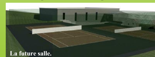
La future salle.

tennis extérieurs. Ce projet permettra de regrouper toutes les activités dans un lieu commun et de libérer les courts de tennis existants qui sont très occupés.