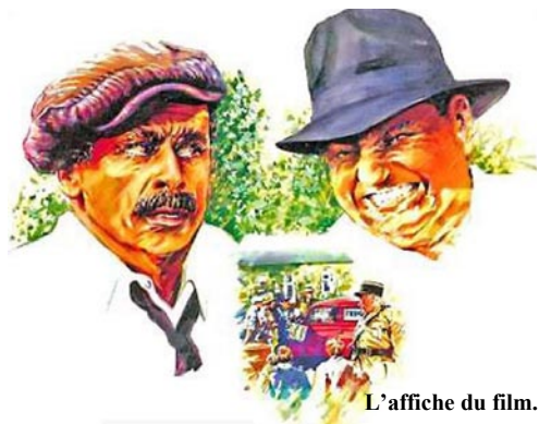
L'affiche du film.

A cette occasion, le film « La Braconne », tourné à Livarot, sera présenté pour la première fois dans la cité livarotaise. Plusieurs surprises sont attendues autour de ce film qui fêtera là son 15ème anniversaire.