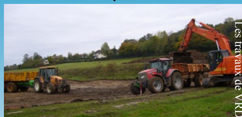
Les travaux de VRD

Conformément aux engagements initiaux, l'Intercom a acheté le terrain pour un euro symbolique à la commune de Fervaques qui lui a remboursé les frais d'acquisition. Cette prise de compétence a permis à la collectivité de recevoir un montant de subventions de 737 560€ notifié.