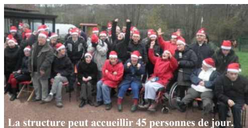
La structure peut accueillir 45 personnes de jour.

veau bâtiment d'accueil est ouvert. Il est composé d'une grande salle de 50m 2 , de 3 salles de 20 m 2 avec deux groupes sanitaires.