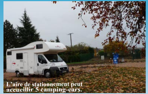
L'aire de stationnement peut accueillir 5 camping-cars.

Une zone de pique-nique couverte a également été pensée. Ce projet a reçu l'appui du Conseil Général à hauteur de 25%.