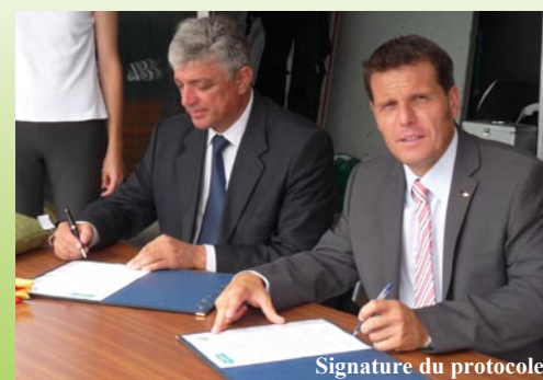
Signature du protocole.

A cette occasion, un protocole d'intention de coopération a été signé entre les deux territoires. Cette charte fondée sur un apport réciproque dans différents domaines comme l'agriculture ou le développement touristique servira de base aux différents échanges futurs.