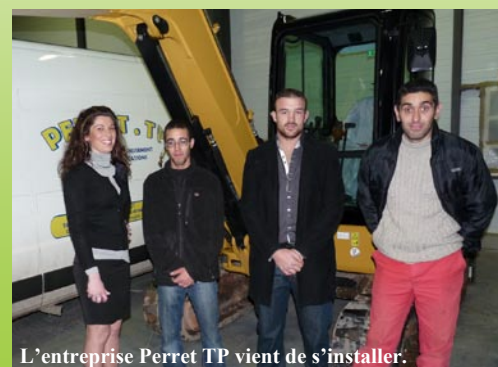
L'entreprise Perret TP vient de s'installer.

Le terrain avait été cédé l'an passé par la CDC pour 1€ symbolique. Ces bâtiments semblent déjà très attendus.